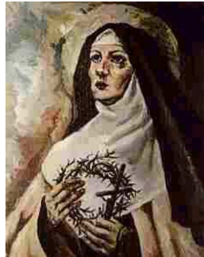
Santa Maria Magdalena con su corona de espinas

Maria tomó largas ramas con espinas de un naranjo y confeccionó una corona como la de Cristo. Estuvo toda la noche con la corona puesta. (Puccini Life 9)