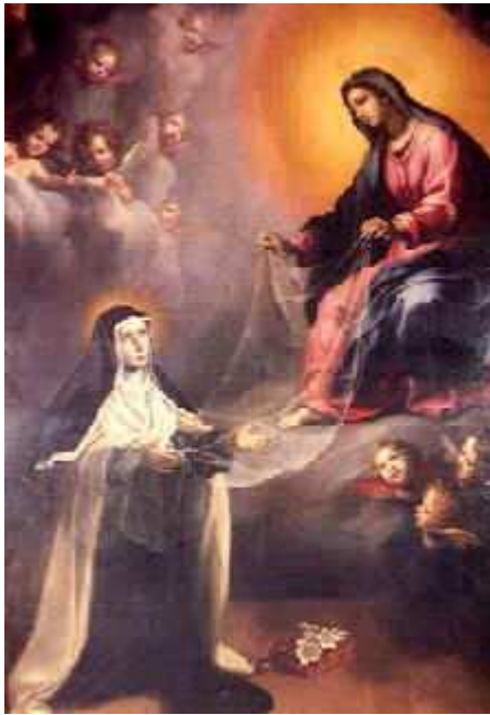
La Santa en sus "visiones"

De esta forma el masoquismo religioso transforma al dolor en algo dulce en vez de algo que debe ser evitado y rechazado.