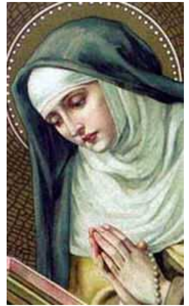
Maria Magdalena en Oracion

"Yo contemplo el gran sufrimiento con ese cordial e incomprensible amor que fue soportado por mi salvación. El ve mis debilidades y con esa imagen de El me siento confortada, porque todos los dolores y sufrimientos que todos los hijos elegidos de Dios han tenido que soportan han pasado por la más santa Humanidad de Cristo, donde crecieron para ser dulces y ser deseada por sus miembros." (Ibid 20)