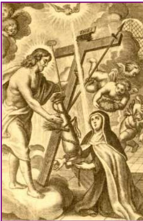
Maria recibiendo los elementos de tortura de las manos de Cristo

"No morir, sino sufrir". "Ni morir ni curar, sino vivir para sufrir."