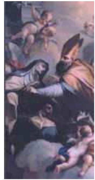
San Agustín escribiendo las palabras " Verbum caro factum est "

de su alucinaciones ella cuenta que San Agustín le escribió en el corazón las palabras " Verbum caro factum est ". El 15 de abril "le fueron impresos para siempre" en el alma los estigmas imaginarios. El 28 del mismo mes recibió del mismísimo Jesús el anillo de matrimonio y se casa con Él.