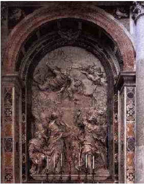
Este Altar conmemora el trato entre Leo I y Atila

Puede hacer click sobre la imagen para ver los detalles