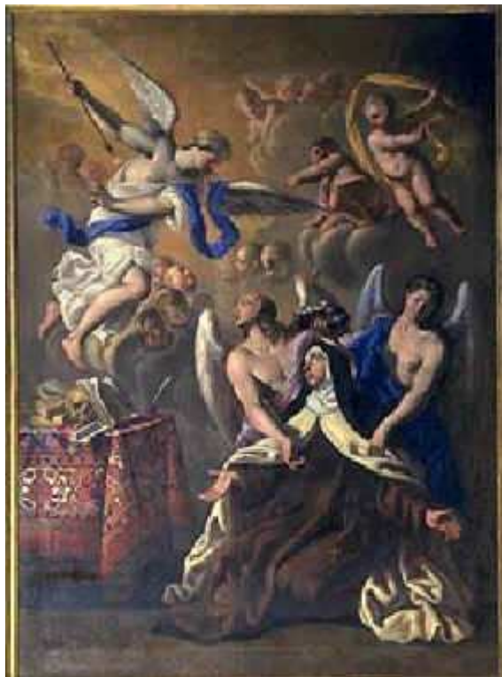
Teresa de Avila

En una era donde se consideraba un pecado el bañarse regularmente, tal comportamiento era motivado por la compulsión tradicional cristiana de negar y destruir los placeres de la carne. Jesucristo aparecía como el esposo de las monjas, estas " sponsae Christi " (esposas de Cristo) y " Christi copulatae ," (!) [Hieron. epist. ad Eust.], quienes vivían una vida célibe en un monasterio. Algunas se sentían impregnadas (sic!) por el Señor Jesucristo. [BF91]