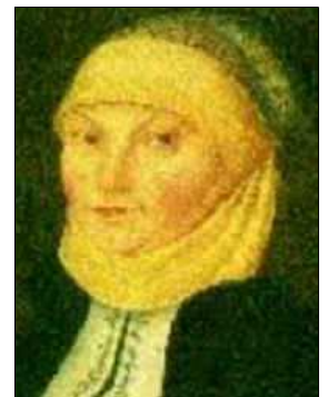
Katherina von Bora

Entre los protestantes Lutero es hoy celebrado por su supuesto respeto al matrimonio y a las mujeres. Más allá de su apoyo para las cacerías de brujas, su opinion negativa hacia las mujeres se pone en manifiesto en su prédica a las embarazadas: