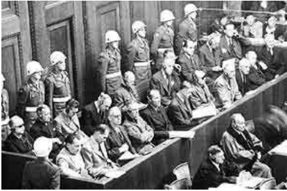
Juicio de Nuremberg

Los últimos años de la vida de Lutero fueron caracterizadas por su mala salud y nuevas preocupaciones sobre el papel mesianico de Jesus. Esto lo llevo hacia un enfrentamiento con el judaismo, el cual el aborrecia.