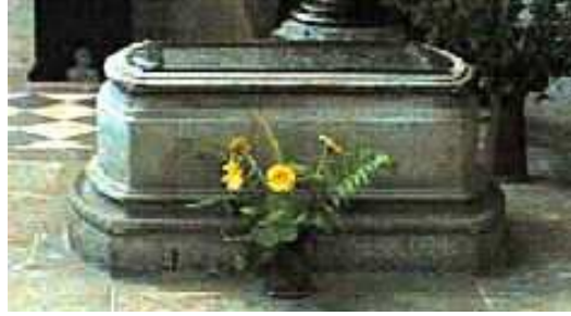
Tumba de Lutero en la Iglesia Castillo de Wittenberg

El 18 de febrero de 1546 Martin Lutero muere en Eisleben a la edad de 63 años. Como resultado de la herejia de Lutero, la hegemonia eclesiastica de la Iglesia Catolica Romana fue destruida y Alemania fue dividida en las sectas catolicas y evangelistas. Mas tarde se esparcería por toda europa.