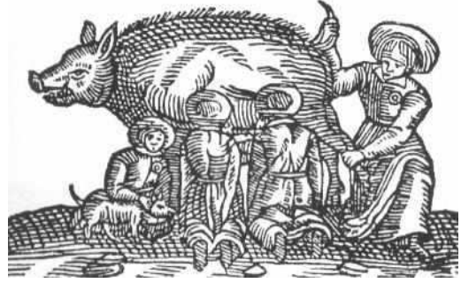
Judensau, judios alimentandose de su madre puerca, según Lutero

Pero si las autoridades se rehúsan a usar la fuerza para restringir al diabólico atropello de los judíos, entonces los judíos, como hemos dicho, deben de ser expulsados de sus países y ordenados a volver... a Jerusalén, a donde puedan mentir, maldecir, blasfemar, difamar, asesinar, robar, asaltar, practicar la usura,