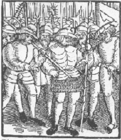
Página título de un panfleto del siglo XVI sobre los "12 Artículos de la Igualdad" que demandaban los campesinos de Alemania

En 1524 durante la guerra de los campesinos, las cuales desbastaron Alemania, Lutero apoyó a las autoridades feudales quienes mataban indiscriminadamente a los campesinos hambrientos y desobedientes no solo moralmente sino también con su incendiaria predica. Él predicaba: