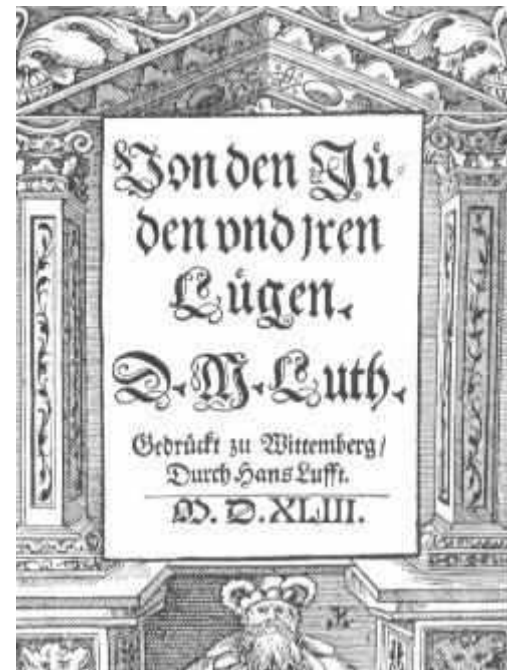
Caratula original del libro

Entre los mas conocidos admiradores de Martín Lutero se encuentran los Nazis alemanes. Su infame libro " Sobre los Judíos y sus Mentiras " de 1543 fue usado como justificación para el Holocausto - el asesinato de 6 millones de judíos durante la Segunda Guerra Mundial - a manos de los alemanes.