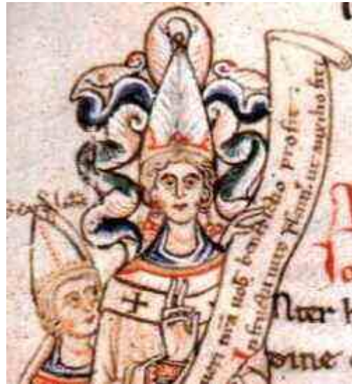
Inocente III - Ilustraci3n en texto de la 3poca

Despu3s de la guerra, la inquisici3n tom3 el mando hasta que los 3ltimos Albigeneses fueron quemados en la hoguera en 1324. La destrucci3n de esta herej3a costo mas de un mill3n de vidas. [WW163-186]