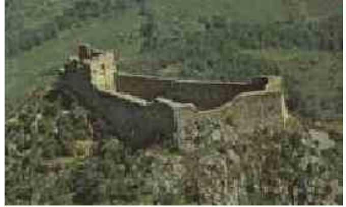
Montsegur. Fortaleza Cátara

En el ba3o de sangre subsiguiente que llego a atormentar al pa3s por veinte a3os, murieron mas de un mill3n de hombres, mujeres y ni3os lacerados, apu3alados, ahogados y descuartizados.