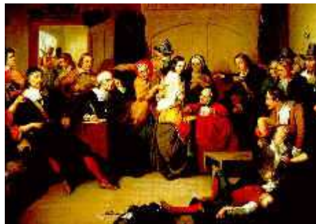
Buscando la marca del Diablo en el cuerpo de una bruja de Salem

Tres niños habian empezado a actuar extrañamente luego de una disputa con una lavandera irlandesa de nombre, Mary Glover. Después de examinar a los pequeños, Mather llegó a la conclusión que eran víctimas de las brujerías de Glover.