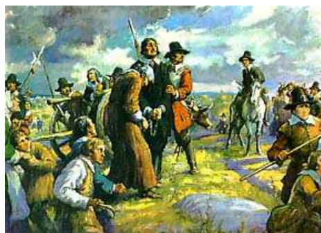
Ejecución de Burroughs

Momentos antes de ser ahorcado, Burroughs miró a la muchedumbre y recitó perfectamente el Padre Nuestro, hazaña supuestamente imposible para un brujo o mago. Su dramático rezo y pedido de misericordia conmovió a los presentes al punto de llorar y dudar de su "culpabilidad".