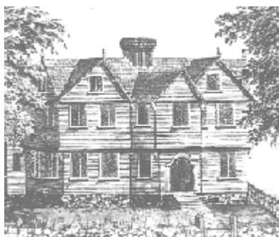
Casa del Rev. Parris en Salem

no lo hubieran leído, seguro que estaban al tanto de su contenido debido a la popularidad del mismo en ese momento.