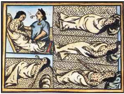
Indios de Nueva Inglaterra sufriendo de viruela siendo asistidos por el curandero

Los colonos importaron la viruela, la comunmente llamada "la divina pestilencia" debido a que esta enfermedad eliminó a 19 de cada 20 habitantes nativos. Un feliz Cotton Mather escribe: