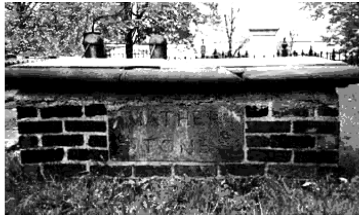
Tumba de Cotton Mather