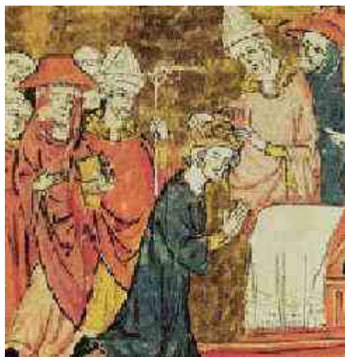
Coronación de Carlomagno

Puede hacer click sobre la imagen para ver los detalles