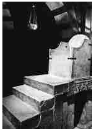
Trono de Carlomagno, Capilla Palatina, Aachen

Fue enterrado en una catedral la cual el mismo construyó y más tarde fue canonizado por la Iglesia Católica el 28 de diciembre del año 1164. [ PHT188 ]