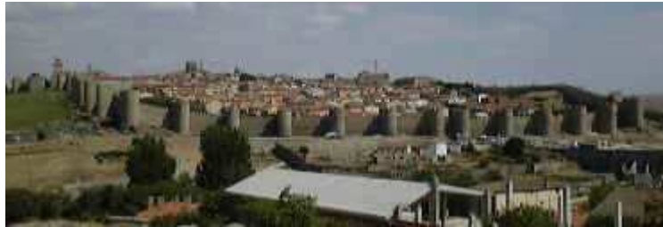
Avila, Castilla Siglo XX

Puede hacer click sobre la imagen para ver detalle