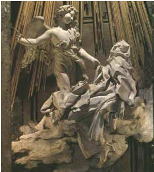
Extasis de Santa Teresa