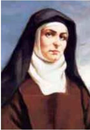
Santa Teresa de Avila

La Enciclopedia Católica llama a Santa Teresa de Ávila la más Grande Mística. Teresa no solamente era mística sino también la reformista de la Orden Carmelita y una escritora prolífica.