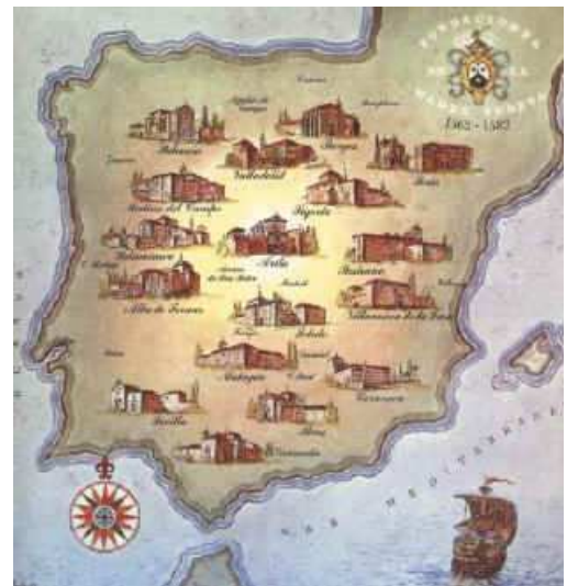
España Siglo XVI

Así Teresa de Cepeda y Ahumanda llegó al mundo 23 años después que Colón llegara a América.